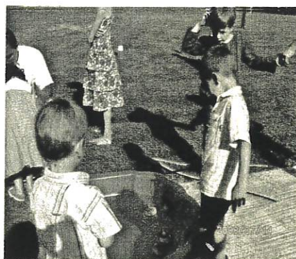
Les tous petits se sont amusés à la pêche aux canards

Pour les 7-10 ans, c'était une chasse au trésor qui leur était proposée, munis de leur carnet de route, ils ont résolu les différentes énigmes qui les ont menées à la personne qui détenait le trésor.