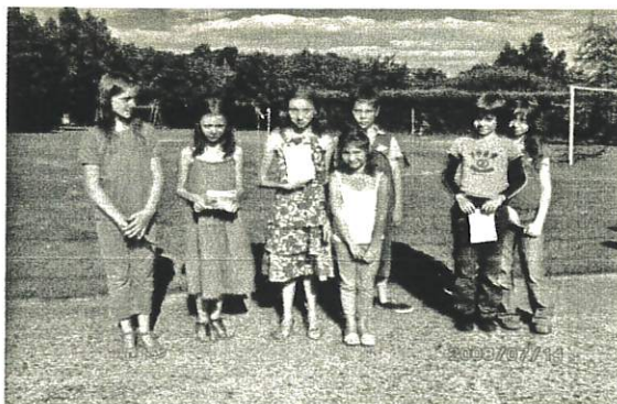
Voici nos petits chercheurs de trésor

Pour les 7-10 ans, c'était une chasse au trésor qui leur était proposée, munis de leur carnet de route, ils ont résolu les différentes énigmes qui les ont menées à la personne qui détenait le trésor.